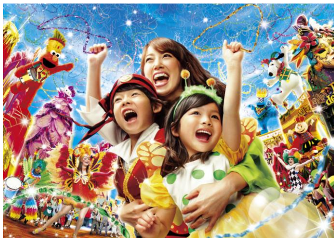
© '14 Peanuts © '76,'14 SANRIO TM / © Sesame

集結全球狂熱盛典的『嘉年華大巡遊』，是影城的秋季例行節目。大巡遊表演者們不斷向沿路遊客拋贈七彩繽紛的串珠頸鏈作為禮物。這項在美國被稱為「懺悔星期二」的傳統表演每年都備受好評。遊客們向秋空伸手狂熱爭奪從繽紛的花車上拋灑而下的珠鏈的激烈場面，將掀起狂歡熱潮。過百名華麗妝扮的表演者，在節奏激昂的現場音樂伴奏下，隨着 9 輛絢爛華麗的花車（移動式舞台）進行大巡遊，把遊客捲入無盡的狂熱漩渦。為了讓小學生以下的小朋友可安全地搶奪珠鏈，特別設置了「兒童專區」，更於『彩色珠鏈派發點』（Stage 18）為未能搶到的小朋友每位派發一條珠鏈。