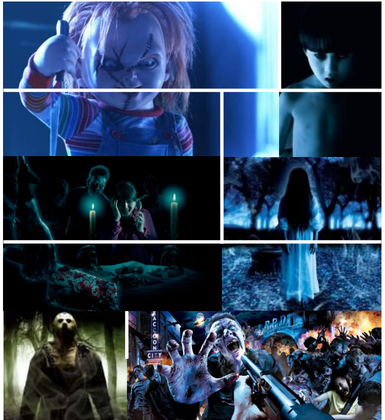
(上段左起)卓奇的恐怖工廠、咒怨～受詛咒的設施～ (中段左起)暗黑餐廳、貞子～受詛咒的設施～ (下段左起)傑森的血色盛宴3、Biohazard the Real 2 ©2013 Universal Home Entertainment ©2014「咒怨—終結的開始」製作委員會 ©KADOKAWA©2013「貞子 3D2」製作委員會 © 2009 Paramount Pictures Corp. and New Line Productions, Inc. ALL RIGHTS RESERVED © CAPCOM CO., LTD. ALL RIGHTS RESERVED.

接踵而來的恐怖熱潮，令遊客為之瘋魔而不能自我，使影城充滿「尖叫狂歡」的『 萬聖驚魂夜 』，將於環球驚喜萬聖節期間，逢星期五、星期六、星期日、星期一及公眾假期的下午6時起，除「哈利波特魔法世界™」及「環球奇境」之外的地區舉行。