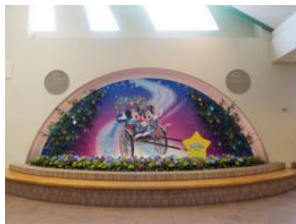
度假區總站 照相景點

迪士尼度假區線的「度假區總站」將配合特別節目「迪士尼迎七夕」設置照相景點，迎接遊客由此展開精采行程。共 4 座迪士尼度假區線車站亦會設置「許願區」，並備有米奇吊環造型的許願卡供乘車遊客索取。