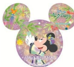
東京迪士尼樂園 商店獨家許願卡