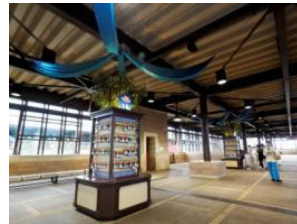
東京迪士尼海洋站 許願區