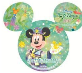
「櫻花餐廳」 「S.S.哥倫比亞餐廳」 獨家許願卡

※特別商品、特別餐飲的內容可能不經預告而變更。商品數量有限，缺貨或售罄時敬請見諒。