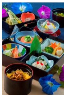
東京迪士尼樂園 「北齋餐廳」 七夕膳