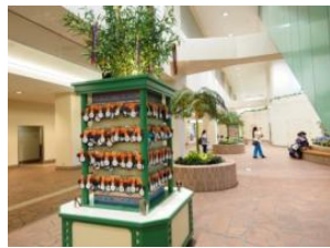
度假區總站 許願區