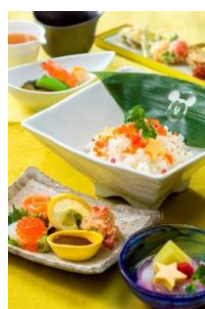
東京迪士尼海洋 「櫻花餐廳」 特別套餐