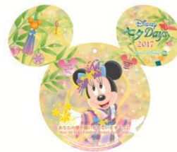
東京迪士尼海洋 商店獨家許願卡