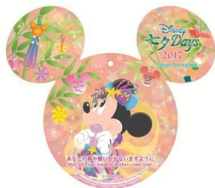
「北齋餐廳」 獨家許願卡