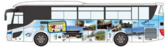
～車身廣告巴士（示意圖）～ 配上了巴士游所去的觀光地的圖片。