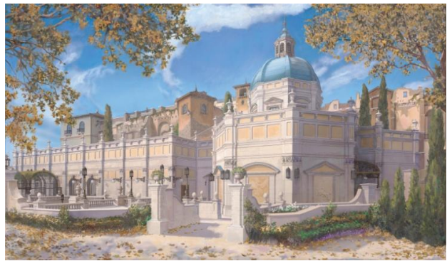
「翱翔：夢幻奇航」外觀概念圖

「翱翔：夢幻奇航」將以迪士尼主題園區廣受歡迎的大型遊樂設施「Soarin' Around the World」為原型，並加入嶄新場景，打造唯東京迪士尼海洋僅有的精彩體驗。遊樂設施將以模擬飛行的方式，帶領遊客於空中探訪世界風景名勝。在徐徐清風、淡淡芬芳相伴的旅途中，遼闊壯觀的影像將令人彷彿身歷其境。