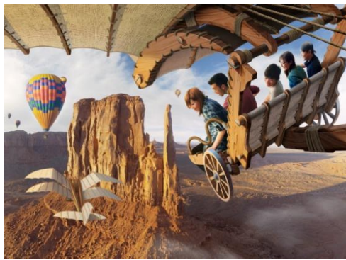
「翱翔：夢幻奇航」體驗概念圖

東京迪士尼海洋的全新大型遊樂設施「翱翔：夢幻奇航」即將於2019年7月23日正式登場，自地中海港灣引領遊客展開一段暢快美好的空中旅程。