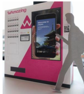
免費SIM卡領卡機 (示意圖)