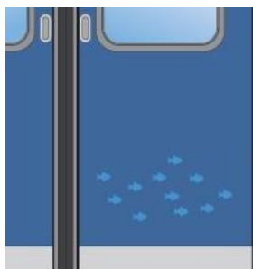
車門打開時，大魚吃小魚的動態

隨著車門的開閉演繹不同的互動效果，車門的玻璃窗上還貼有可愛的貼紙，從車窗外看仿佛是在潛水一樣。