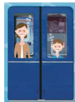
乘客站立時好像在潛水一樣