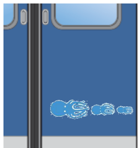
車門關閉時，章魚被裝進陶罐的動態