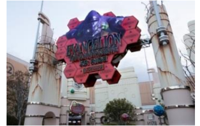
※圖片為前次舉辦時的場景。